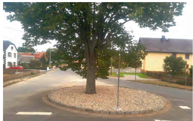
Neugestaltung des Rondell im Ortsteil Niegeroda, Dank an die TIEKU Mühlbach für die Unterstützung