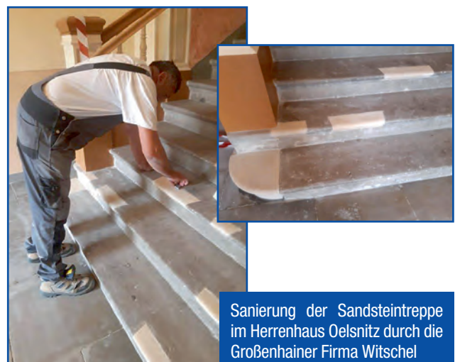
Sanierung der Sandsteintreppe im Herrenhaus Oelsnitz durch die Großenhainer Firma Witschel